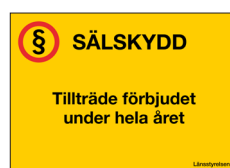
Sälskyddsskylt Tillträde förbjudet Nr 307 420x297 mm