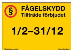
Fågel- och sälskyddsskylt Tillträde förbjudet Nr 301 420x297 mm

Skyltar för fågel-, säl- och övriga djurskyddsområden.