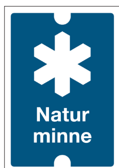
Gränsmarkeringsskylt Naturminne 104 70x100 mm