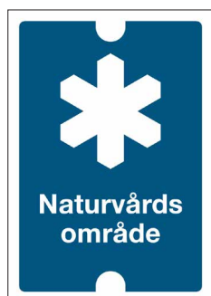
Gränsmarkeringsskylt Naturvårdsområde Nr 103 70x100 mm