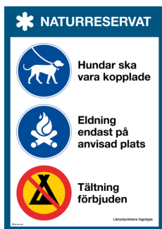
Skylt Hundar, eldning, tältning Nr 415 210x297 mm