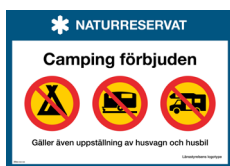
Skylt Camping förbjuden Nr 413 297x210 mm