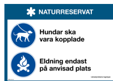
Skylt Hundar, eldning Nr 417 297x210 mm