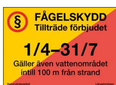
Fågel- och sälskyddsskylt Tillträde förbjudet Nr 302 420x297 mm