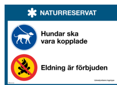
Skylt Hundar, eldning Nr 418 297x210 mm