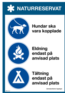
Serieskylt Hundar, eldning, tältning Nr 416 210x297 mm