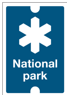
Gränsmarkeringsskylt Nationalpark Nr 101 70x100 mm

Gränsmarkeringar används i gränslinje för att ange typ av skyddat område.