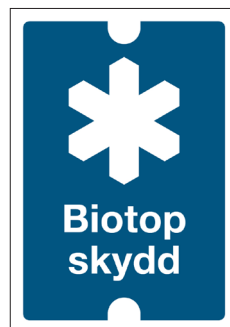
Gränsmarkeringsskylt Biotopskydd Nr 105 70x100 mm