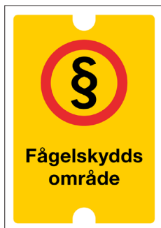
Gränsmarkeringsbricka Fågelskyddsområde Nr 108 70x100 mm