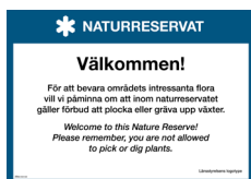
Skylt Välkommen Nr 410 297x210 mm