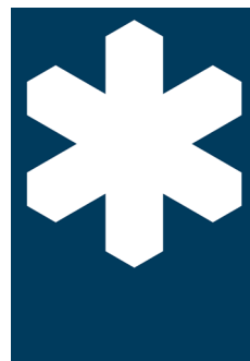
Dekal Naturvårdssymbolen Nr 207 200x290 mm