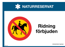
Skylt Ridning förbjuden Nr 421 297x210 mm