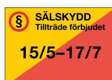
Sälskyddsskylt Tillträde förbjudet Nr 308 420x297 mm