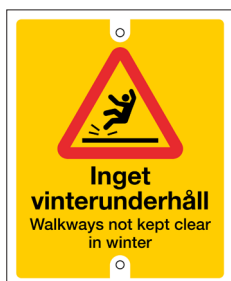
Bricka Inget vinterunderhåll Nr 402 90x110 mm