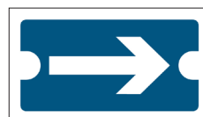
Bricka, pil Nr 107 70x40 mm