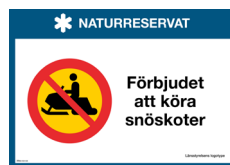
Skylt Snöskoter förbjuden Nr 420 297x210 mm