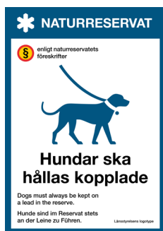
Skylt Hundar ska hållas kopplade Nr 406 210x297 mm