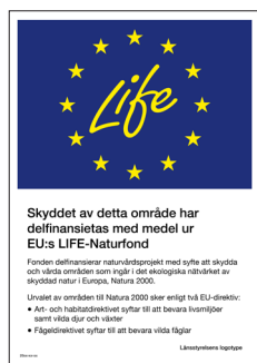
Skylt Life Nr 408 210x297 mm