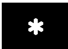
Målningsschablon Naturvårdssymbolen Nr 113 Tunn plast, diameter 65x75 mm Format schablon, 297x210 mm