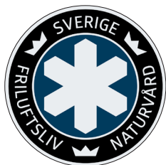
Naturvårdssymbolen Nr 202 Diameter 85 mm