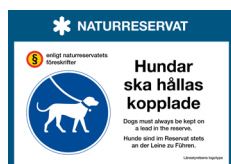
Skylt Hundar ska hållas kopplade Nr 407 297x210 mm