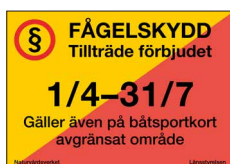
Fågel- och sälskyddsskylt Tillträde förbjudet Nr 303 420x297 mm