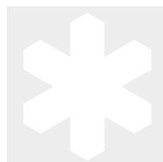
Naturvårdssymbol Nr 210 500x75 mm