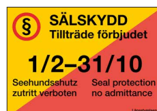
Sälskyddsskylt Tillträde förbjudet Nr 306 420x297 mm