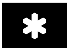
Målningsschablon Naturvårdssymbolen Nr 111 Tunn plast, stjärna 105x120 mm Format schablon, 297x210 mm