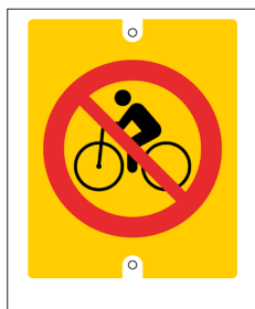
Bricka Cykling förbjuden Nr 401 90x110 mm

Exempel på förbuds- och påbudsbrickor och -skyltar.