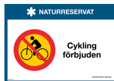
Skylt Cykling förbjuden Nr 419 297x210 mm