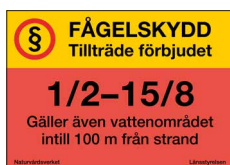
Fågel- och sälskyddsskylt Tillträde förbjudet Nr 304 297x210 mm