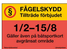
Fågel- och sälskyddsskylt Tillträde förbjudet Nr 305 420x297 mm

Fågel- och sälskyddsskylt som presenterar och marknadsför systemet omfattande tre olika fågel- och sälskydd där en röd-gul färgkombination är specifik för varje datum.