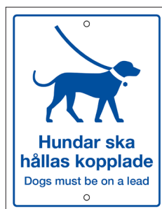
Bricka Hundar ska hållas kopplade Nr 405 90x115 mm