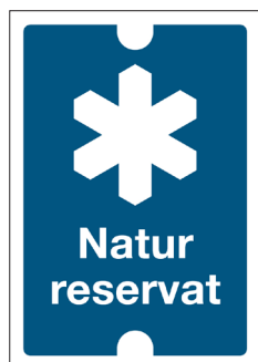
Gränsmarkeringsskylt Naturreservat Nr 102 70x100 mm