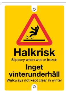
Bricka Halkrisk Nr 403 90x125 mm