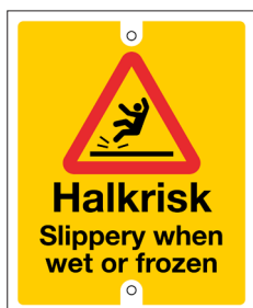
Bricka Halkrisk – Slippery Nr 404 90x110 mm