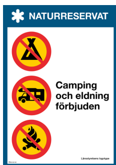
Skylt Camping och eldning förbjuden Nr 411 210x297 mm