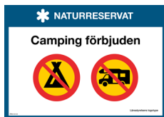
Skylt Camping förbjuden Nr 414 297x210 mm