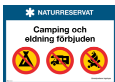
Skylt Camping och eldning förbjuden Nr 412 297x210 mm