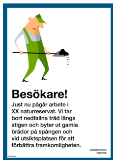
Skylt Besökare Nr 409 210x297 mm